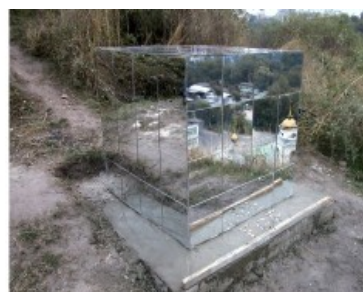
"Станция №1", 2001 г., гора Замковая