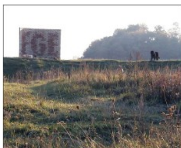
"Остановка", 2000 г., гора Щекавица