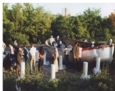
"Отплытие", 1996 г., гора Щекавица

конструкция из цилиндра, призмы и куба, объединенных треугольником. В основу как общей композиции, так и отдельных объемов была заложена космическая цифровая константа, число 108. В результате был смоделирован универсальный знак, выявляющий преемственность с культурами прошлого и неизбежность основ человеческого мышления.