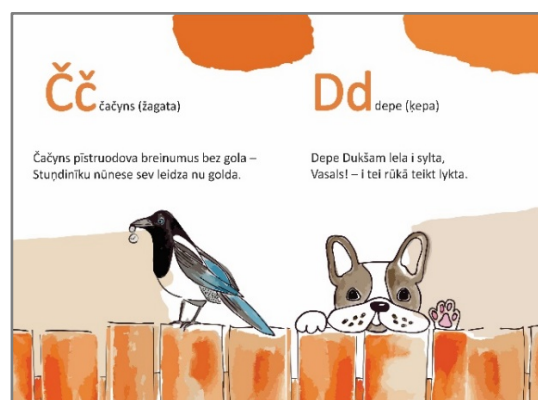
4. attēls. Trešais grāmatas atvērums Figure 4 The 3rd Opening of the Book

Bērnu grāmatu dizains ļauj pārkāpt ierastos likumus, taču autore izvēlējās par labu ierastajam - melni burti uz balta fona, neaizsedzot ilustrācijas, kas kognitīvajā ergonomikā ir atzītākais, labāk uztveramais variants.