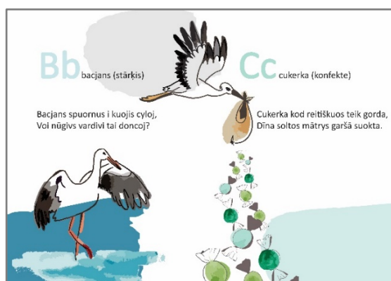
3. attēls. Otrais grāmatas atvērums Figure 3 The 2nd Opening of the Book