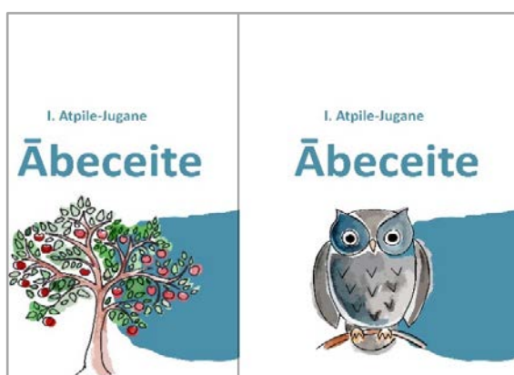
1. attēls. Grāmatas vāka varianti Figure 1 Book Cover Variants

Trešais atvērums: burts Č – čāčyns (žagata); Čāčyns pīstruodova breinumus bez gola /Stuņdinīku nūnese sev leidza nu golda un burts D – depe (ķepa); Depe Dukšam lela i sylta, /Vasals - i tei rūkā teik lykta! Žagata pagalmā ir vēstnesis, kad gaidāmi ciemiņi, kā arī laimīgas tikšanās simbols, un šī tikšanās šoreiz ir ar draudzīgo Duksi, kurš jau sniedz ķepu sveicienam. Suns var būt bērna labākais draugs, rotaļbiedrs, sargs un palīgs.