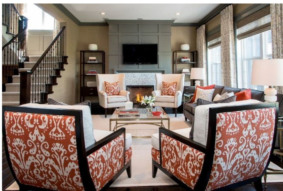
Изображение 3. Применение иката в современном интерьере Figure 3 Use of ikat in modern interior

Этно–стили в интерьере переживают всплеск своей популярности. Их яркость и динамизм привносят в повседневную жизнь радостную атмосферу праздника. С помощью узоров можно кардинально преобразить интерьер, а грамотное использование текстур делает его более выразительным и чувственным. Многие орнаменты имеют не только замысловатую форму, но и богатую историю, по-прежнему оставаясь привлекательными, с точки зрения дизайна (Расинэ, 2004). Значимость орнамента в интерьере уже давно прочувствована и дизайнерами, и ценителями «живой» атмосферы в доме – он избавляет любое помещение от тусклости, безжизненности и интерьерной «тишины».