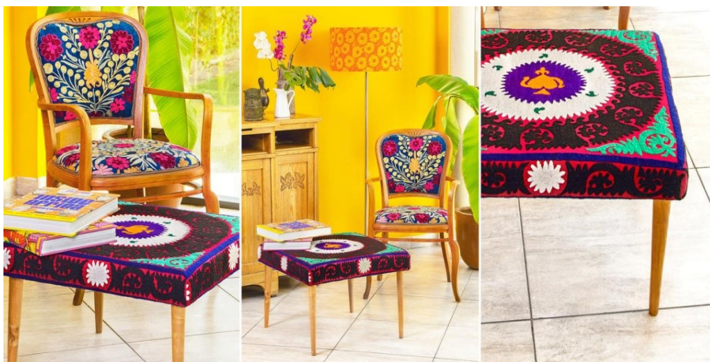
Изображение 4. Домашняя мебель, декорированная сюзане.