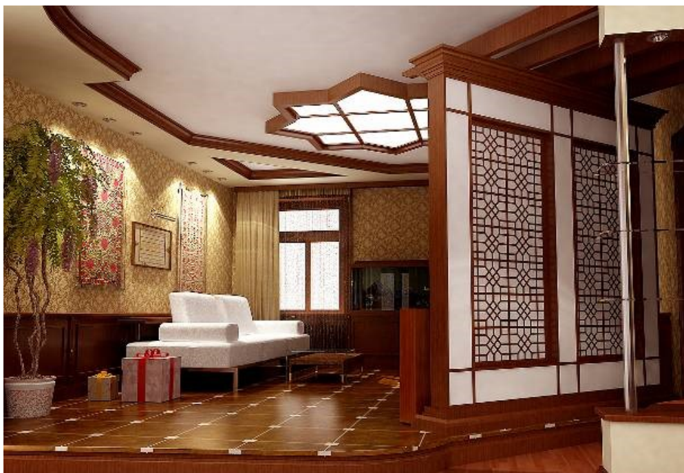
Изображение 2. Интерьер современного жилого дома в восточном этно-стиле, арх. Фаттахов О. К. Ташкент, Узбекистан Figure 2 Interior of the modern house in eastern ethno-style, architect – Fattakhov O. K. Tashkent, Uzbekistan

Так, в дизайне интерьера современного жилого дома, представленного на фотографии снизу (арх. Фаттахов О. К.) прослеживается нечто созвучное узбекским традициям, чувствуется ощущение комфорта, уюта, тепла; здесь можно отдохнуть от обыденной суеты и отвлечься от будничных дел и окунуться в узбекскую культуру. (Махмудова, 2012).