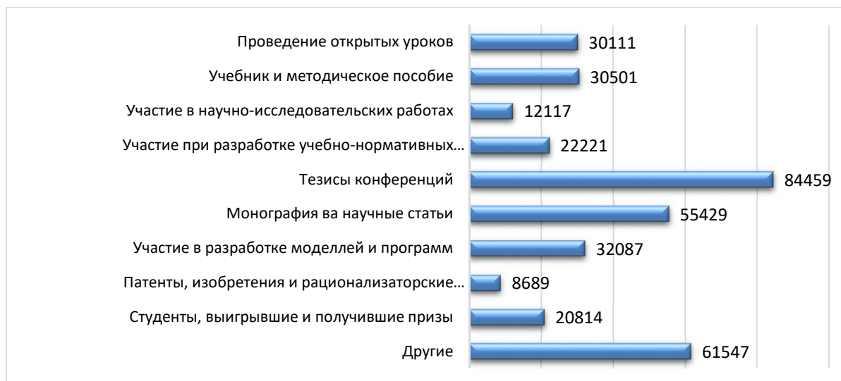
Рисунок 2. Сведения результатов профессиональной деятельности слушателей Fig 2 Results of the professional activity of listeners

Эти три направления в свою очередь делятся на 9 категории. До января 2017 года итогов больше 350 000 сведений были внесены в систему в качестве результатов профессиональной деятельности педагогами, и эта информация постоянно обновляется (2-, 3- рисунки).