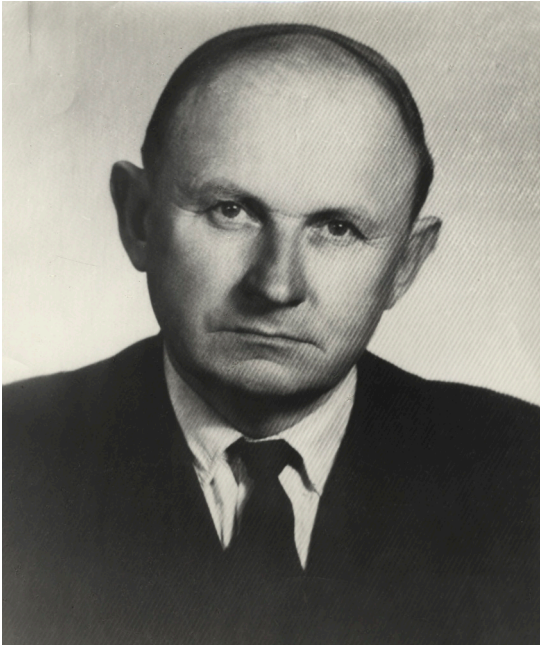
1. attēls. Stepona Seiļa portrets Picture 1. Portrait of Stepons Seiļš