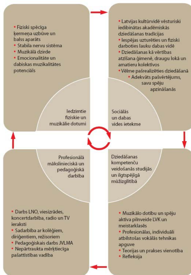
2. attēls. Kārļa Zariņa ilgdziedāšanas fenomenu veidojošie komponenti.

Lai vienotā sistēmā atspoguļotu Kārļa Zariņa ilgdziedāšanas fenomenu veidojošos komponentus, tika izdalītas četras mākslinieka personību veidojošās pamatvienības un katrā no tām iezīmēti raksturīgākie rādītāji. Tas atspoguļots 2. attēlā.