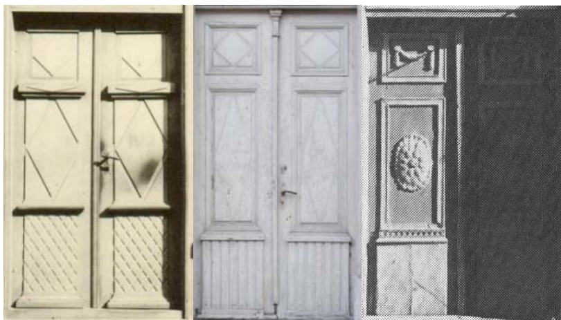
24., 25. un 26. attēls. Kombinētas konstrukcijas trīsdalījuma ārdurvju vērtņu pāris Kuldīgā (BCB) (nav saglabāts), dzīvojamai ēkai Liepājā, Kungu ielā 24 (SO) un Jelgavā, Jura Mātera ielā (Siliņš, 1979: 105)

Aizputē ārdurvju vērtņēm ēkai Jāņa ielā 7 augšējo pildiņu atstāja bez dekora, bet cokola daļas plāksni gropēja. Vidusdaļā ar kokgriezuma stūrīšiem radīja ovālu pamatni atbilstošas formas „saulītei” (28.att.). Ēkai Kuldīgas ielā 5a vērtnes augšdaļu uzsvēra izteiksmīgs „saulītes” motīva rotājums (29.att.), bet vidusdaļu – ovālas formas „saulīte” (28. un 29.att.) un cokola plāksni veidoja daļēji gropētu. Aizputē trīsdalījuma ārdurvju vērtņēm vidusdaļā veidoja profilētu ierāmējumu, kurā ievietoja ar romba reljefu rotātu pildiņu (31., 32., 33. un 34.att.). Ja ārdurvju vērtnes kompozīcijas akcentējošo dekora elementu izvietoja centrālajā daļā, tad vērtnes augšējo un apakšējo plāksni veidoja salīdzinoši neitrālu, virsmas apdarei izmantojot smalku gropējumu. Vērtņu augšējai plāksnei akcentēja stūrīšus (32., 33. un 34.att.) un veidoja piekariņus (31.att.). Rotājumam izmantoja festonu (31. un 34.att.). Aizputē sētas mājai Jāņa ielā 10 vidējam pildiņam nav rotājuma, taču augšējo un apakšējo plāksni rotā skaisti kokā griezti dekori (30. att.). Grota nama ārdurvju vērtņēs pildiņi izvietoti vidus un lejasdaļā (34. att.).