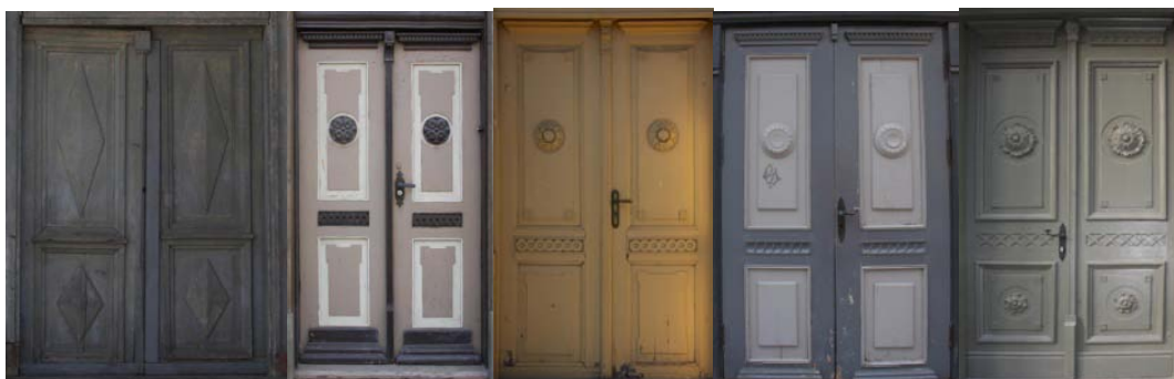
6., 7., 8., 9. un 10. attēls. Rāmja konstrukcijas divdalījuma ārdurvju vērtņu pāris Bauskā, Rīgas ielā 22 (SO), Liepājā, Johana Mittelmaņa ēkai Dīķa ielā 7 (SO), ēkai Skolas ielā 16 (SO), E. Veidenbauma ielā 8 (SO), A. Pumpura ielā 5 (SO)

Ventspilī rāmju konstrukcijas trīsdalījuma ārdurvju vērtnes vidējo pildiņu akcentēja zieda rozete (11. att.). Ārdurvju vērtņu pildiņu rotājumam iegrieza ģeometrisko dekoru – rombu (12., 13., 14., 15. un 17. att.) un dekoratīvus stūrīšus (11., 14. un 15. att.), bet profilētu ierāmējumu neveidoja. Ar rombu rotātā vidējā pildiņa stūrīšus akcentēja ar kokgriezumu (14. att.) vai arī pildiņa stūra laukumu līdz romba malai pārveidoja par dekoratīvu stūrīti (15. att.). Arī tad, ja vidējo pildiņu atstāja bez rotājuma, dekoratīvus stūrīšus tomēr veidoja (16. un 17. att.). Dzīvojamo ēku ārdurvīm bez virsloga vērtnes augšējā pildiņa vietu aizpildīja stiklojums (15. un 16. att.). Cokola daļā ievietoja gropētu pildiņu (11., 14., 16. un 17. att.).