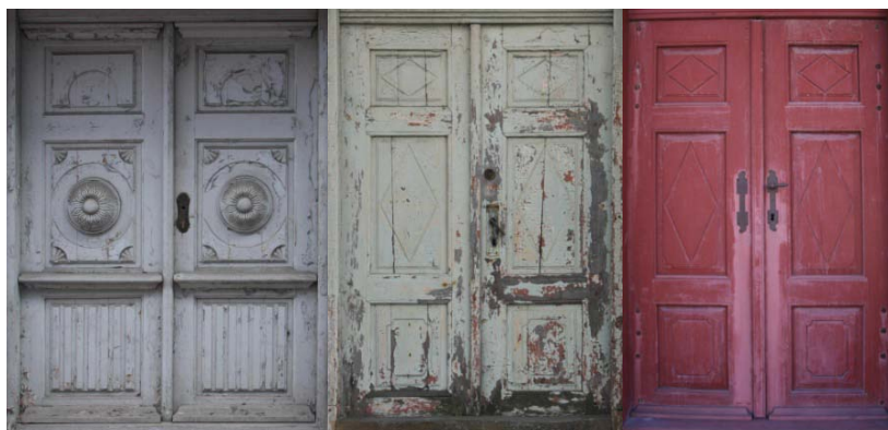
11., 12. un 13. attēls. Rāmja konstrukcijas trīsdalījuma ārdurvju vērtņu pārisdzīvojamai ēkai Kuldīgā, Skrundas ielā 14 (SO), Ventspilī, Lielajā ielā 16 (SO), Akmeņu ielā 5 (SO) un Audēju ielā 15 (SO)

Ventspilī rāmju konstrukcijas trīsdalījuma ārdurvju vērtnes vidējo pildiņu akcentēja zieda rozete (11. att.). Ārdurvju vērtņu pildiņu rotājumam iegrieza ģeometrisko dekoru – rombu (12., 13., 14., 15. un 17. att.) un dekoratīvus stūrīšus (11., 14. un 15. att.), bet profilētu ierāmējumu neveidoja. Ar rombu rotātā vidējā pildiņa stūrīšus akcentēja ar kokgriezumu (14. att.) vai arī pildiņa stūra laukumu līdz romba malai pārveidoja par dekoratīvu stūrīti (15. att.). Arī tad, ja vidējo pildiņu atstāja bez rotājuma, dekoratīvus stūrīšus tomēr veidoja (16. un 17. att.). Dzīvojamo ēku ārdurvīm bez virsloga vērtnes augšējā pildiņa vietu aizpildīja stiklojums (15. un 16. att.). Cokola daļā ievietoja gropētu pildiņu (11., 14., 16. un 17. att.).