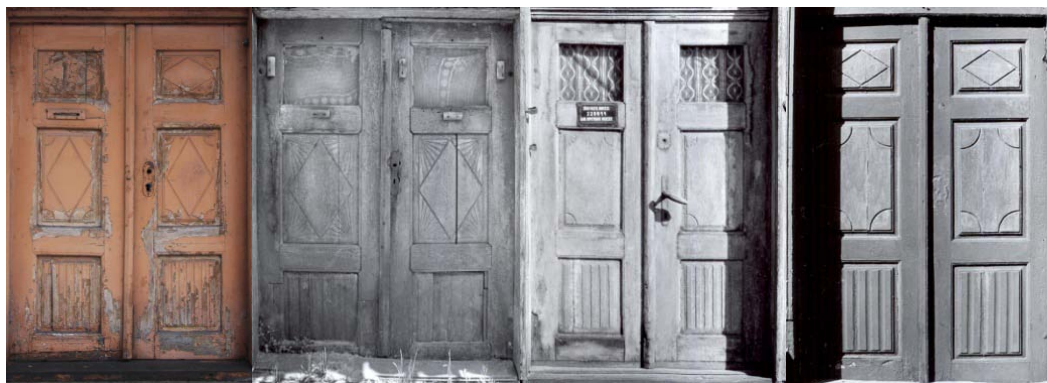
14., 15., 16. un 17. attēls. Rāmja konstrukcijas trīsdalījuma ārdurvju vērtņu pārisdzīvojamai ēkai Ventspilī, Rožu ielā 2 (SO), Ģertrūdes ielā 5 (VM), Pils ielā 4 (VM) un Ūdens ielā 7 (VM)