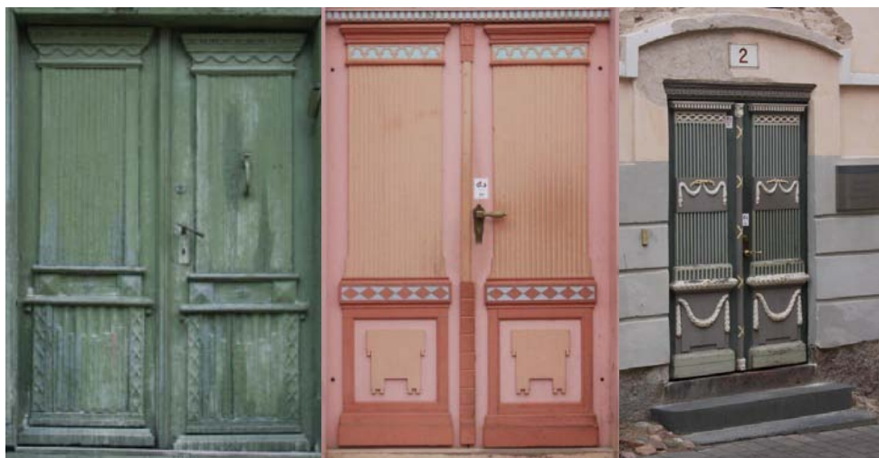
35., 36. un 37. attēls. Viengabala ārdurvju vērtnes ar dalījumu divās daļās Kuldīgā, Kalna ielā 15 (SO), Tartu Rotaļlietu muzeja ēkai (SO) un Tartu, Kuutri ielā 2 (SO)