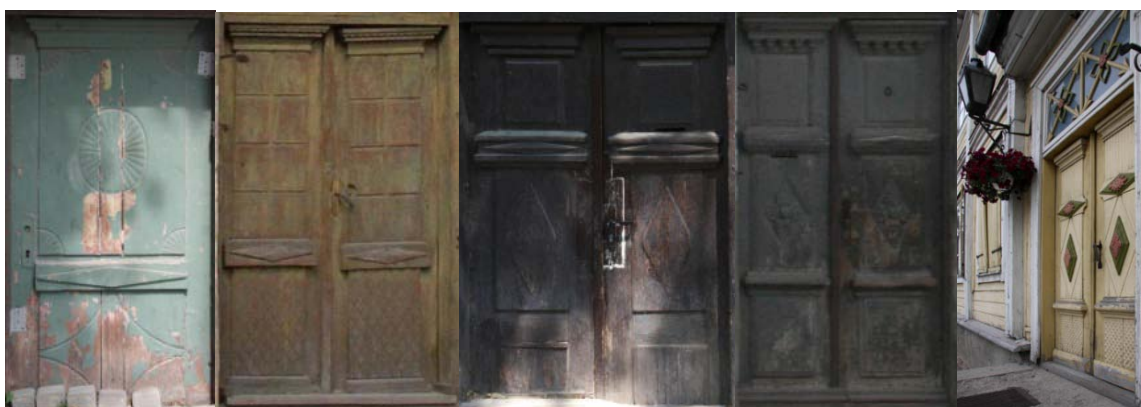
1. un 2. attēls. Viengabala ārdurvju vērtne ar dalījumu divās daļās Liepājā, Peldu ielā 42 (SO) un vērtņu pāris Kuldīgā, Jelgavas ielā 32 (SO)

Kuldīgā dzīvojamās ēkas viengabala ārdurvju vērtnei ar dalījumu trīs daļās vidējā plāksnē iegriezts rombs (3. att.) vai lapu rozete ar izstieptu krustveida dalījumu (4. att.), kuras attīstības starpposmi rāda sākotnējās formas pāreju „saulītes” motīva (1., 29., 31. un 32. att.) rotājumā (Zilgalvis, 1987: 141). Ēkai Kuldīgā, Baznīcas ielā 7 lapu rozete novietota uz rombveida plaknes (5. att.). Joslu starp augšējām plāksnēm aizpilda izstieptas formas rombs (3., 4. un 5. att.).