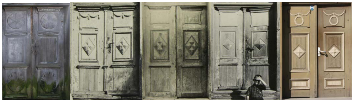
30., 31., 32., 33. un 34. attēls. Trīsdalījuma ārdurvju vērtņu pāris Aizputē, sētas mājai Jāņa ielā 10 (SO), trīs neidentificētām ēkām (VKPAI) (nav saglabāts) un Grota namam Atmosdas ielā 31 (SO)