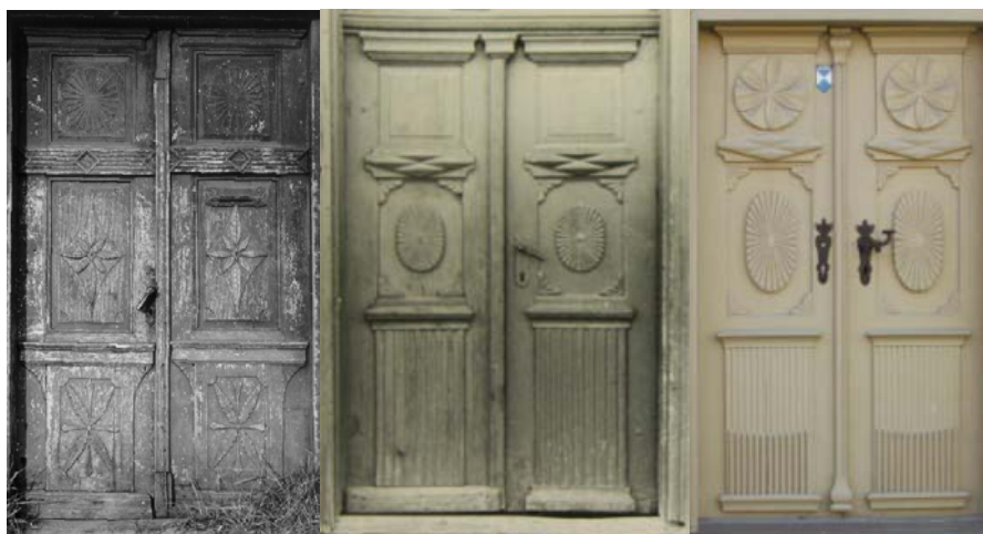
27., 28. un 29. attēls. Kombinētas konstrukcijas trīsdalījuma ārdurvju vērtņu pāris ēkai Bāriņu ielā 1a (LB) (nav saglabāts), Aizputē, Jāņa ielā 7 (VKPAI) (nav saglabāts), un Kuldīgas ielā 5a (SO)

Aizputē ārdurvju vērtņēm ēkai Jāņa ielā 7 augšējo pildiņu atstāja bez dekora, bet cokola daļas plāksni gropēja. Vidusdaļā ar kokgriezuma stūrīšiem radīja ovālu pamatni atbilstošas formas „saulītei” (28.att.). Ēkai Kuldīgas ielā 5a vērtnes augšdaļu uzsvēra izteiksmīgs „saulītes” motīva rotājums (29.att.), bet vidusdaļu – ovālas formas „saulīte” (28. un 29.att.) un cokola plāksni veidoja daļēji gropētu. Aizputē trīsdalījuma ārdurvju vērtņēm vidusdaļā veidoja profilētu ierāmējumu, kurā ievietoja ar romba reljefu rotātu pildiņu (31., 32., 33. un 34.att.). Ja ārdurvju vērtnes kompozīcijas akcentējošo dekora elementu izvietoja centrālajā daļā, tad vērtnes augšējo un apakšējo plāksni veidoja salīdzinoši neitrālu, virsmas apdarei izmantojot smalku gropējumu. Vērtņu augšējai plāksnei akcentēja stūrīšus (32., 33. un 34.att.) un veidoja piekariņus (31.att.). Rotājumam izmantoja festonu (31. un 34.att.). Aizputē sētas mājai Jāņa ielā 10 vidējam pildiņam nav rotājuma, taču augšējo un apakšējo plāksni rotā skaisti kokā griezti dekori (30. att.). Grota nama ārdurvju vērtņēs pildiņi izvietoti vidus un lejasdaļā (34. att.).