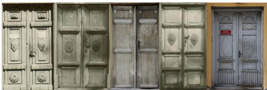
43., 44. un 45. attēls. Dzīvojamās ēkas arhaiskas trīsdalījuma ārdurvju vērtņu pāris Kuldīgā, Liepājas ielā 17 (dekors pēc durvju atjaunošanas saglabāts daļēji) (BCB), Kalna ielā 23 (BCB) un Ventspils ielā 23 (SO) 46. un 47. attēls. Dzīvojamās ēkas arhaiskas ārdurvju vērtnes ar dalījumu četrās daļās Kuldīgā, Kalna ielā 13 (BCB) un Ventspilī, Tīrgus ielā 7 (SO)

Trešā tipa dzīvojamo ēku ārdurvju vērtnes raksturo dalījums trīs (43., 44. un 45. att.), četrās (46. att.) un vairākās daļās (47. att.). Klasicisma periodā celtniecības un amatniecības tradīciju ietekmē durvju dekoratīvo formu kompozīcija mainījās un zaudēja arhitektonisko formu skaidrību (Zilgalvis, 1987: 142). Uz izvirzītajām plaknēm uztagoja ģeometrisku ornamentu, rombveida vai ovālu rozeti (43., 44. un 46. att.), vai aplim tuvu zieda formu (43. att.). Dekoram izvēlējās arī maskas (43. att.). Konstruktīvās detaļas un dekora elementi noslogoja ārdurvju vērtnes virsmu. Palielinājās dekoratīvā risinājuma neatbilstība ārdurvju vērtņu konstrukcijai. Proporcionālais dalījums ar plastiska un ģeometriskā ornamenta joslām (43., 44., 45. un 46. att.) zaudēja līdzsvarotību. Veidojās jauni ārdurvju vērtņu risinājumi.