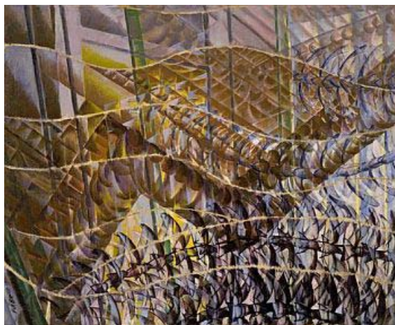
3.attēls. Džakomo Ballā Bezdelīgu lidojums

nav tik ļoti „datorizējusies”. Aptaujātie skolēni dzimuši 1993., 1994. gadā, bet Latvijā datortehnoloģijas iestādēs „ienāca” 1996. gadā. Mājsaimniecībās tās masveidā sāka izmantot ap 2000. gadu, tad cilvēka datora mijiedarbība ir ietekmējusi šo vecuma grupu (Bute, 2012: 35).