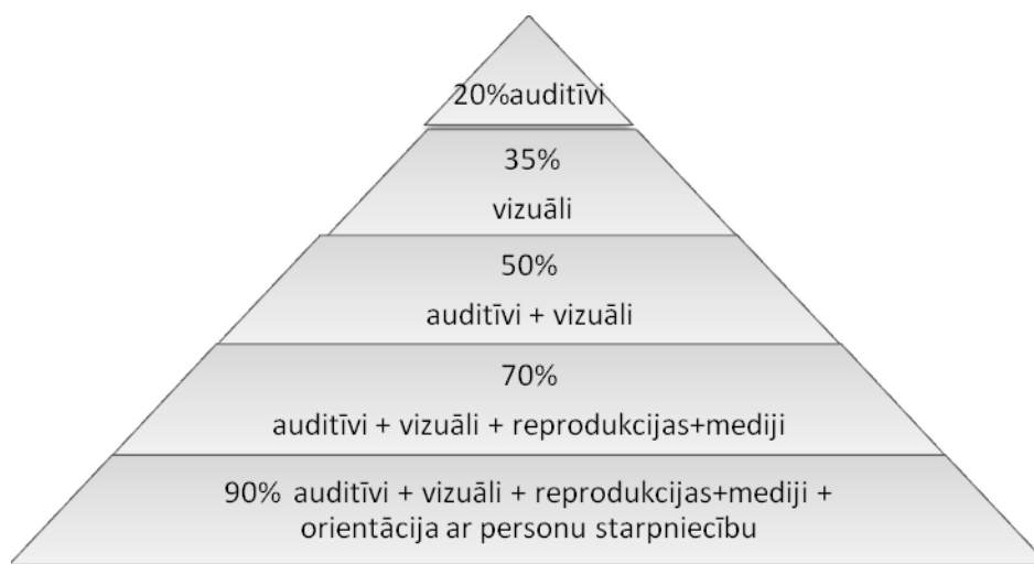
2. attēls. J. Riņķa piedāvātie mācīšanās tipi. (Riņķis, 2002: 43)

Revolūcijas komunikācijas jomā izraisīja pārmaiņas cilvēka dzīves vidē. Mainījās informatīvā slodze, kas jāiztur cilvēka sensorajām sistēmām, kā rezultātā priekšplānā izvirzījās vizuālā informācijas uztvere.